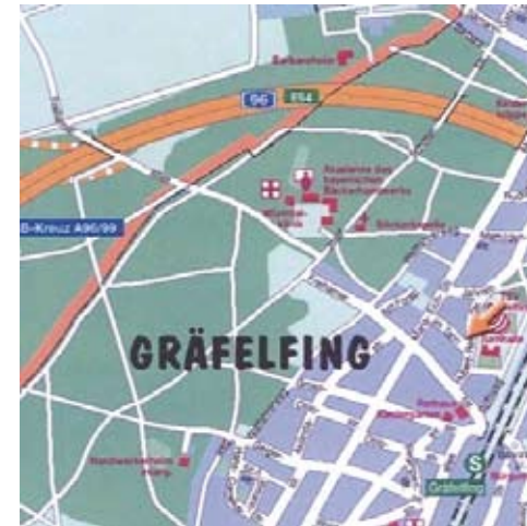
Akademie des bayerischen Bäckerhandwerks, Josef-Schöfer-Strasse 1, 82166 Gräfelfing

Beratung und telefonische Anmeldung unter : Tel.: 089/544 213 0 Sie können sich auch per Email anmelden unter lochham@baecker-bayern.de